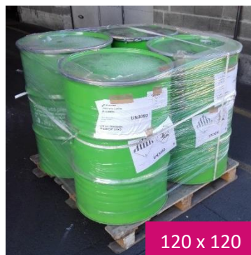
120 x 120