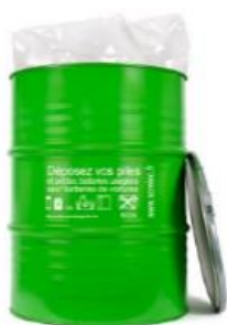
Fût avec sache plastique

Les bacs ou les fûts doivent impérativement être conditionnés dans un endroit sec, à l'abri des intempéries et accessibles avec un transpalette