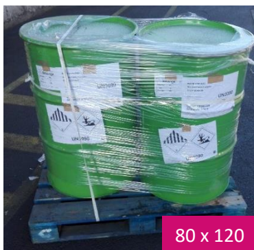
80 x 120