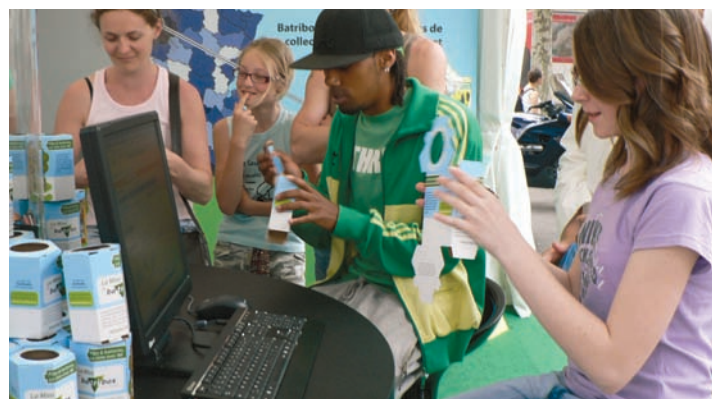
Foire de Paris 2007

La tournée de la Mini Batribox à travers 8 centres commerciaux exploités par Unibail-Rodamco a permis d'en diffuser 50 000 exemplaires. Sur des périodes