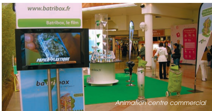
Animation centre commercial

La nouvelle Mini Batribox sera disponible au mois d'avril, mais la voici en avant-première.